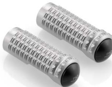
Austauschraste, Ausführung PE630