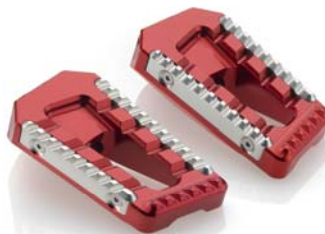
Austauschraste, Ausführung PE622