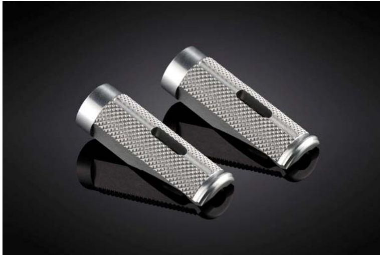
Austauschraste, Ausführung PE614