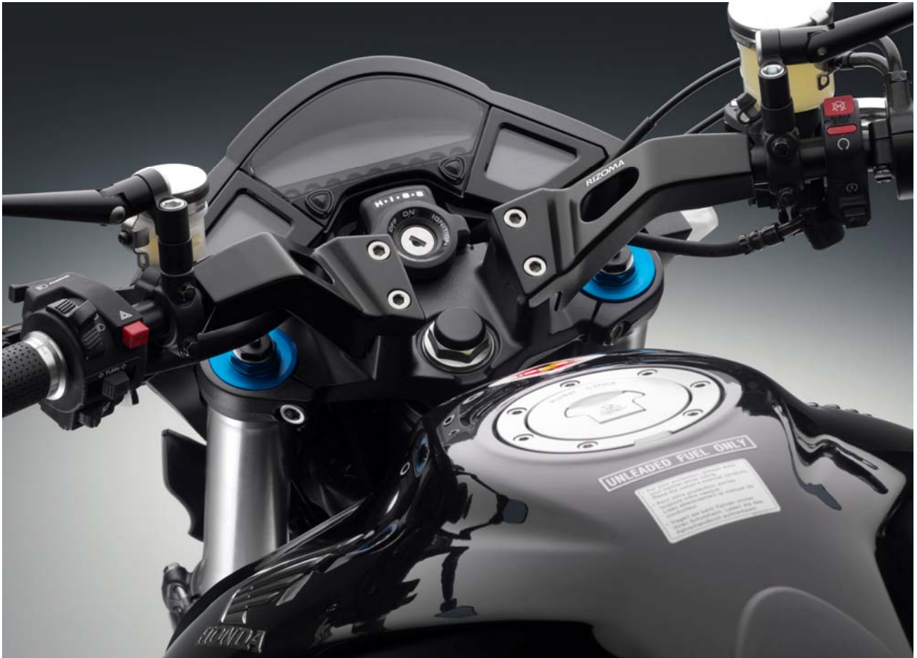
Sonderlenker, Typ MA 206