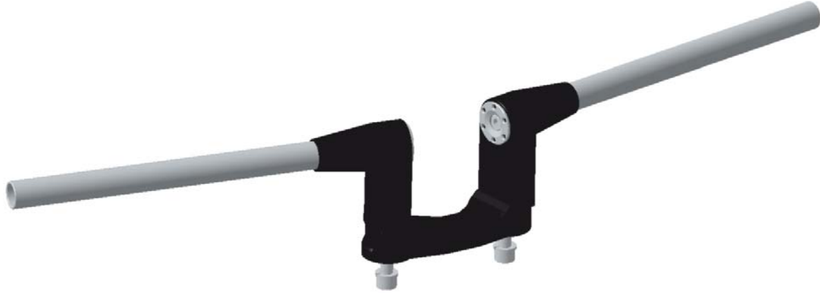
RIZOMA LENKER TYP MA208