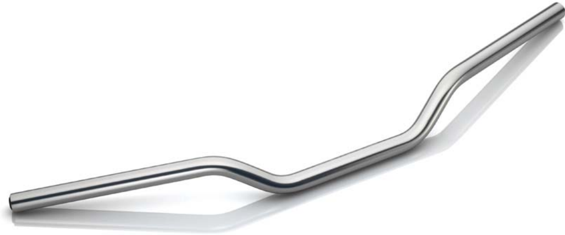
Lenker, Typ MA001