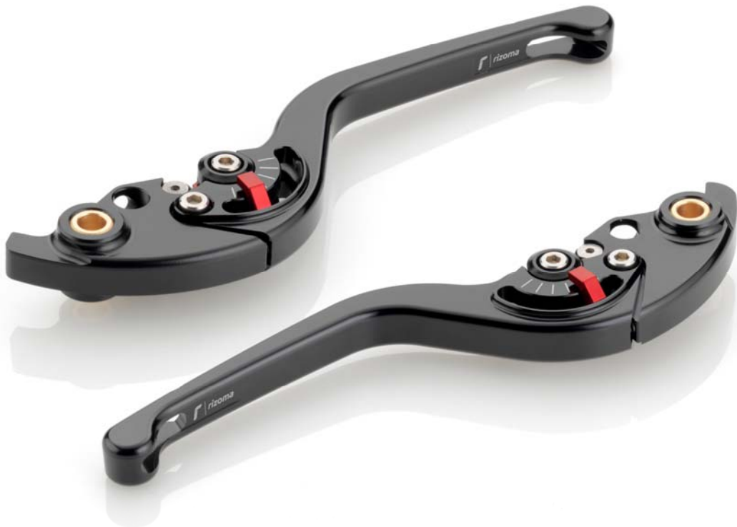
Rizoma Austauschhandhebel, Typ RZ Ausführung LBR u.LCR