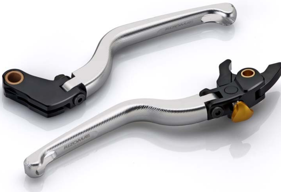
Rizoma Austauschhandhebel, Typ RZ Ausführung LB u.LC