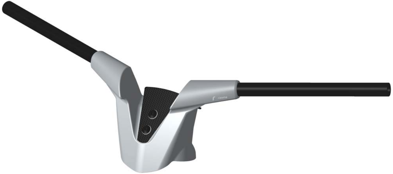
RIZOMA LENKER TYP MA207