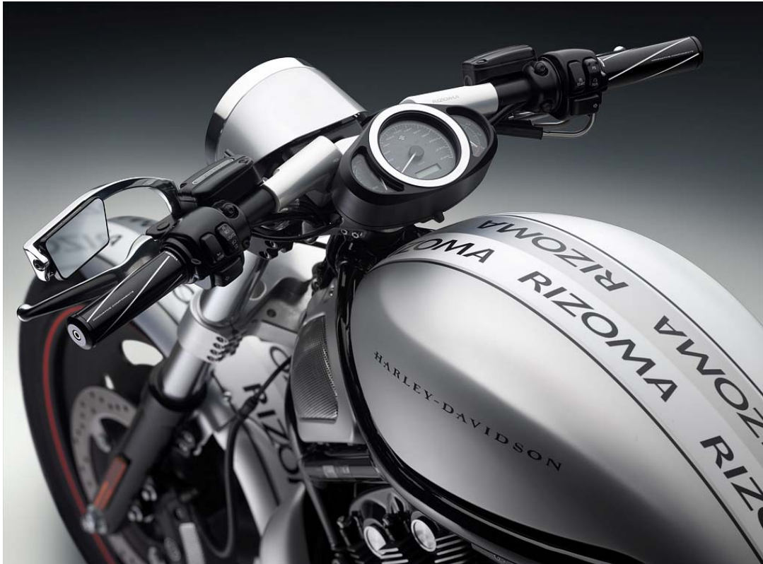
Sonderlenker, Typ MA 204